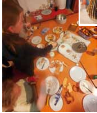
Lebendiger Advent und Adventsfeier mit den Gemeindepädagog:innen