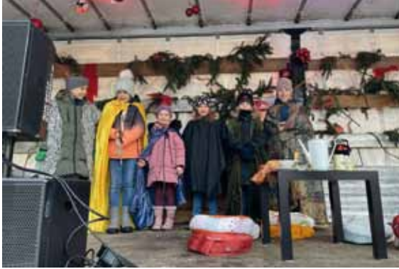
Anspiel mit den Parkentiner Hortkindern zum Adventsmarkt