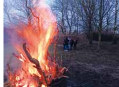
Winterfeuer der Pfadfinder-Gruppe