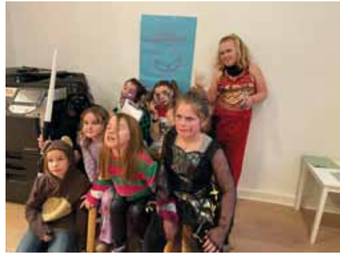
Fasching in Lambrechtshagen, mit jeder Menge Spiel, Musik, und Fratzen schneiden ;-)