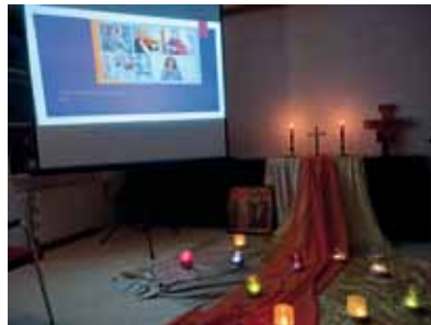
Taizé-Andacht mit Bildern aus Ljubljana