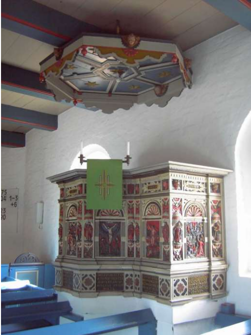
Kanzel der St.-Johannis-Kirche