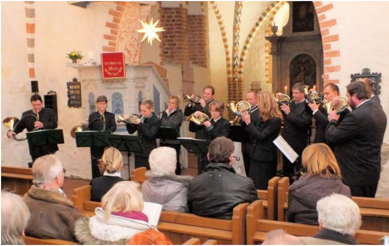
Neujahrsempfang mit den Jagdhornbläsern am 12. Januar 2014