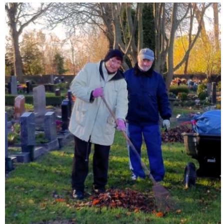
Fleißige Helfer beim Laubfegen