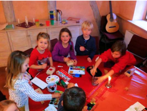
Die Christenlehre-Kinder malen und basteln