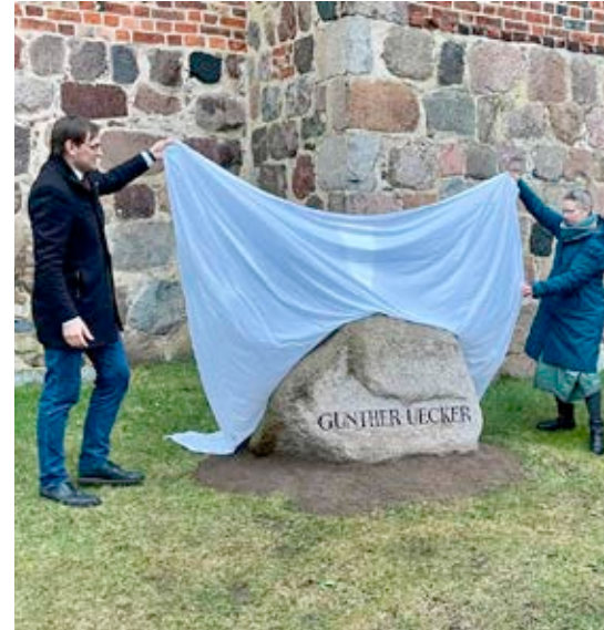
Enthüllung Gedenkstein Uecker

die wegen des Dauernieselwetters größtenteils in der Kirche stattgefunden hat. Trotz des bescheidenen Wetters fand dieses Ereignis einen großen Widerhall in Rerik. Das hat mich gefreut für diesen neuen Gedenkort in unserer Stadt. Der Abend wurde in der Kösterschün fortgesetzt mit Vortrag, Film und guten Gesprächen. JDL