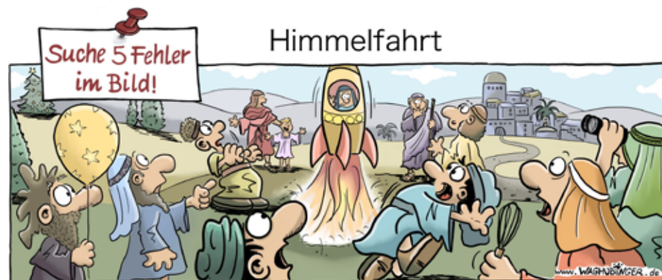
Weihnachtsbaum, Luftballon, Kakeke, Schneebesen, Fernglas