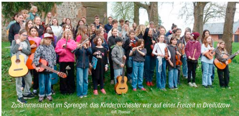
Zusammenarbeit im Sprengel: das Kinderorchester war auf einer Freizeit in Dreilützow

wird auch gefragt, ob bei einer kleiner werdenden Familie noch alle Räume bewohnt werden können und müssen. Derzeit wissen wir noch nicht genau, was bei den Umbaumaßnahmen herauskommt. Jede Familie (Gemeinde) hat Vorstellungen und Wünsche. Das wird am Küchentisch besprochen (im Sprengel)