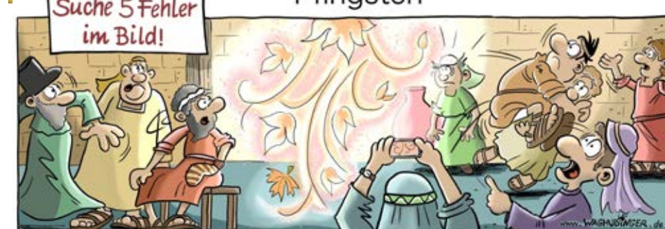
Zylinder, Handschuh, Blatt, Armbanduhr, Handy