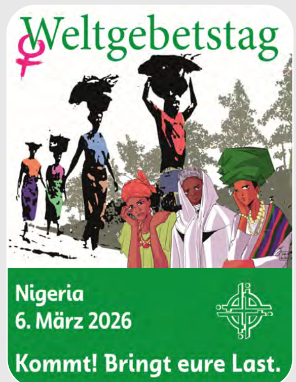
Titelbild Weltgebetstag 2026: Gift Amarachi Ottah „Rest for the Weary“ (Erholung für die Müden)

Seien Sie dazu herzlich willkommen am 6. März 2026 um 14.30 Uhr im Pfarrhaus in Kirchdorf.