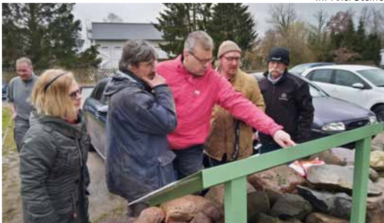
Arbeitseinsatz April 2023

Arbeitseinsatz 23. September 09.00 Uhr bis 12.00 Uhr Pfarrhof Kessin