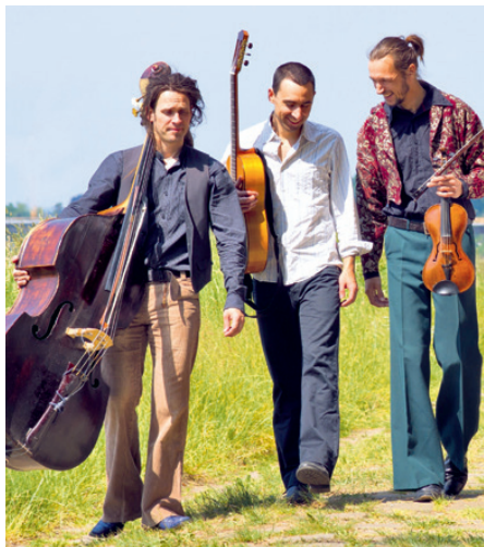
Das Trio Ziganimo.

Musikabend mit der Gruppe Ziganimo – Musik von hier und anderswo am 30. Mai um 19.30 Uhr in der Dambecker Pfarrscheune