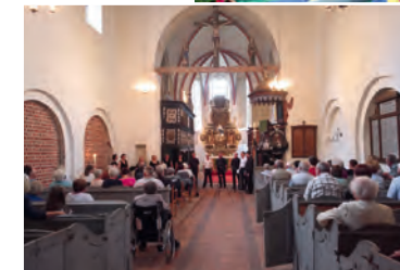
Konzert in Lübow