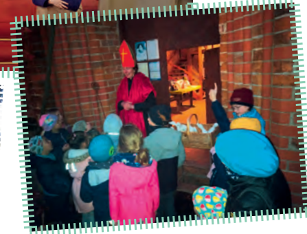
Probe fürs Martinsspiel in Dambeck, Kinder beim Verschnaufen.