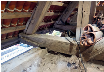
Dachstuhl der Lübower Kirche.

Am Chor der Lübower Kirche steht seit einigen Wochen ein Gerüst. Es zeugt davon, dass an der Kirche gebaut wird.