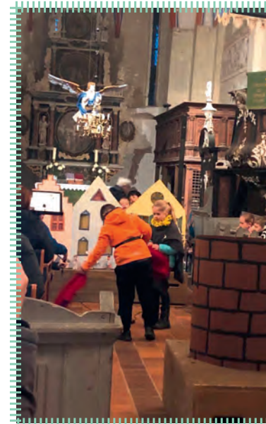
Martinsspiel in Lübow