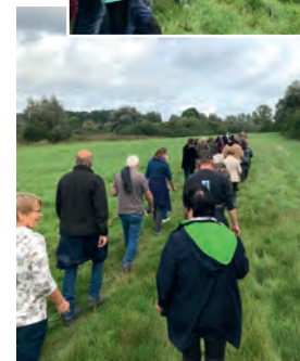
Eindrücke von unserer Wanderung durch das Naturschutzgebiet Dambecker Seen.