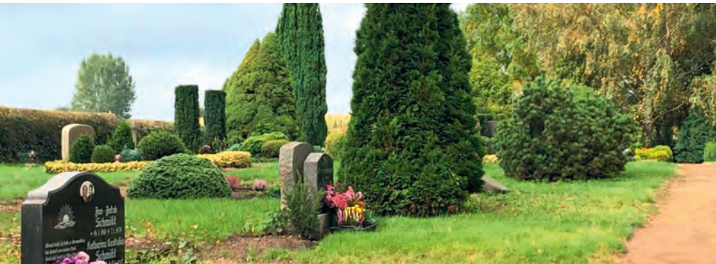
Friedhof Hohen Viecheln.