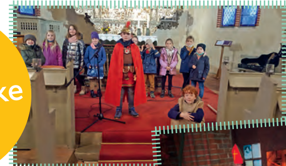
Martinsspiel in Dorf Mecklenburg