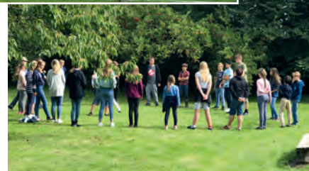
Unser Gemeindefest mit dem Regionalen Kinderorchester.