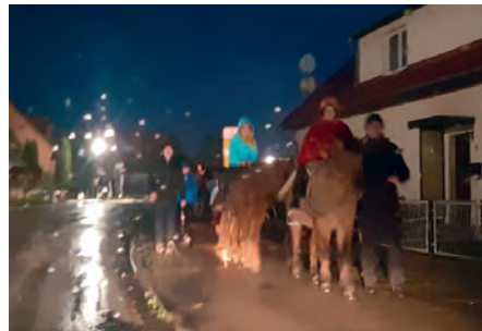
Martinstag in Lübow.

Zur Feier des Martinstages in der Lübower Kirche ritt St. Martin nicht durch Schnee und Wind. Martin und seine Begleiter ritten durch Sturzbäche und stürmische Winde. So einen Martinstag hat es ja noch nie gegeben, meinte jemand und sprach vom Regen, der sich allen Wetterberichten entgegen, am Nachmittag und Abend des 4. Novembers mehr als reichlich über das Land ergoss. Auch, wenn das gemütliche am Feuer stehen und dort Martinshörnchen teilen ins Wasser fiel, waren viele Familien gekommen. Die Kinder der Lübower Schule führten ein Martinspiel auf und ein Kinderchor sang aus voller Kehle. Weihnachtspäckchen für Albanien wurden gebracht und ein fröhlicher Martinszug drehte zumindest eine kleine Runde. Für die, die durchhielten, gab es Punsch und Martinshörnchen. Auch die beiden