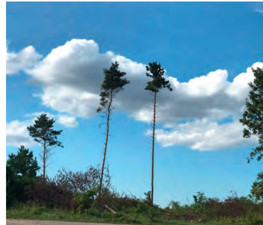
Der abgeholzte Kirchenwald.

Doch so soll es nicht bleiben. Schon im Frühjahr 2022 wollen wir dort mit Kindern und Jugendlichen eine Aufforstaktion starten.