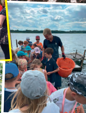
Beim Fischer am Schweriner See.