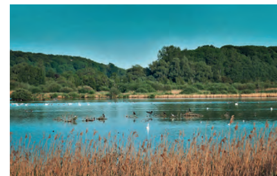
Naturschutzgebiet Dambecker Seen.