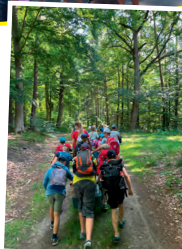
Die Jungs hatten schwer zu schieben.