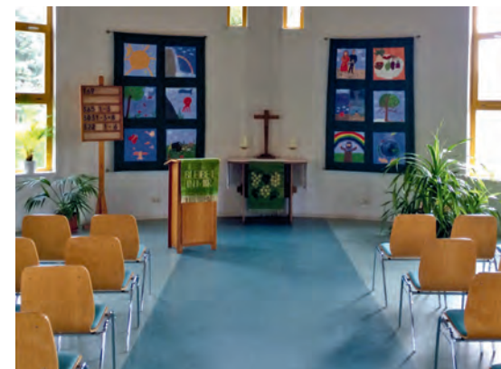
Die Arche von innen.

Wie soll die Zukunft der Arche aussehen? Die Arche ist schadhaft! Dringend ist die Regenentwässerung her zu stellen, ist jetzt aber in Bearbeitung. Ebenso ist der Holzturm vor dem weiteren verfaulen im Grund zu schützen und der Anschluss des Daches an den Turm und das Mauerwerk zu sanieren.