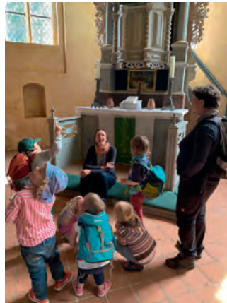
Die Natur- und Waldkita zu Besuch in der Dambecker Kirche.