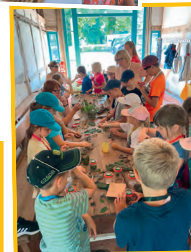
Kinder begutachten ihre Fundstücke.