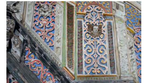
Kanzel | Probeachse.

Im vergangenen Jahr konnte mit Hilfe der Ella Freifrau von Lüttwitz Stiftung eine Probeachse an der Kanzel angelegt werden, die einen Eindruck vom restaurierten Zustand ermöglicht. Während der Arbeiten entdeckten die Restauratorinnen viele interessante Details. Darüber und über Möglichkeiten, die Restaurierung der Kanzel weiter zu verfolgen, möchten wir gern informieren.