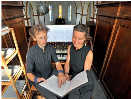
Das Duo Vimarís.

Die Coronaregeln ändern sich immer wieder. Und trotzdem machen sich Künstler*innen auf, um die große Kirche in Hohen Viecheln, den Pfarrgarten und die Arche zu bespielen. Nach dem Berliner Fahrradchor hoffen wir sehr, dass wir das Duo Vimarís und den Chor Bad Kleinen in unseren Räumen und zu unser aller Freude begrüßen dürfen.