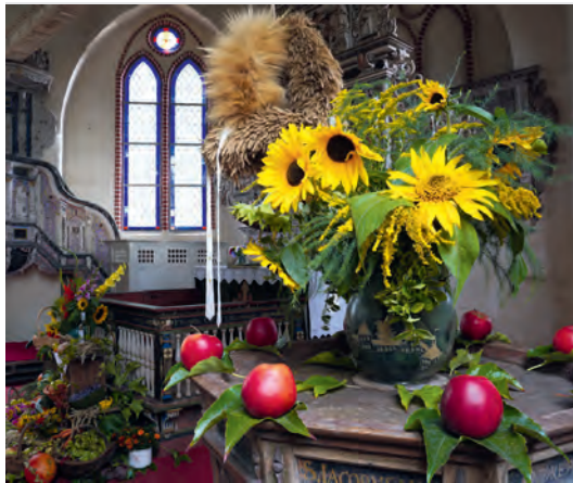
Erntedank in Dorf Mecklenburg.

von 9.00 bis 12.00 Uhr auf dem Kirchhof und dem Pfarrgelände.