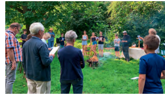
„Feuer und Flamme“ im Juli.

Eine besondere Einladung sprechen wir aus zur Musikalischen Abendandacht zum Buß- und Betttag ( 17. November, 17.00 Uhr ) in der Arche.