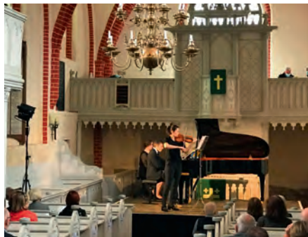
Festspielsontag in Beidendorf am 8. August.