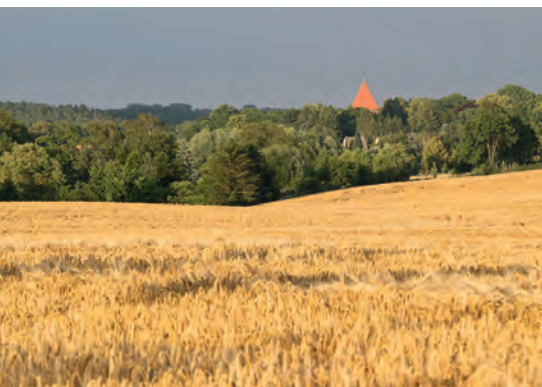
Blick nach Lübow.

Erntedankgaben sind willkommen. Diese können Sie am 9. Oktober um 10.00 Uhr in der Kirche abgeben.