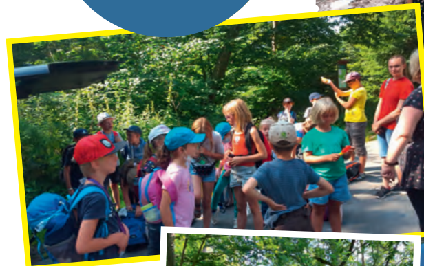
Start ins Radebachtal.