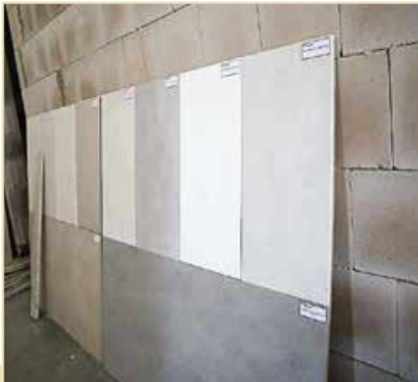
Muster für die verschiedenen Wandfarben