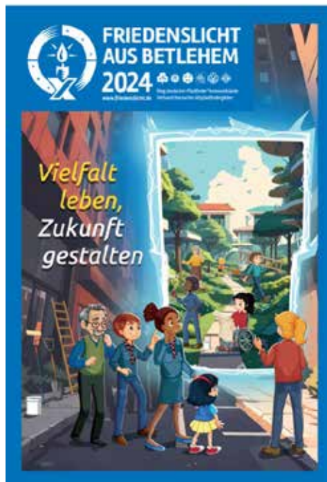
Plakat : Friedenslicht

Am 23. Februar 2025 werden wir wieder zum Kleingruppen- und Hauskreistag eingeladen. „Wir helfen einander im Glauben zu wachsen“. So heißt es in unserem Leitbild der Gemeinde. Die überschaubare Gruppe und darin die persönliche Begegnung – sie helfen bei den regelmäßigen Treffen, den eigenen Weg im Vertrauen auf Gott zu gehen. Das kann beim Spielkreis oder der Tansaniagruppe im Gemeindehaus oder eben auch beim Bibelgespräch im privaten Umfeld sein. Nach dem Gottesdienst wird es Zeit zu einem Predigt-nachgespräch geben. Im Gemeindehaus decken wir uns gegenseitig den Tisch mit den verschiedenen Lieblingssuppen. Zum Abschluss um 12.30 Uhr gibt es noch einen inhaltlichen Impuls. Gegen 13.30 Uhr schließen wir unser Treffen ab.