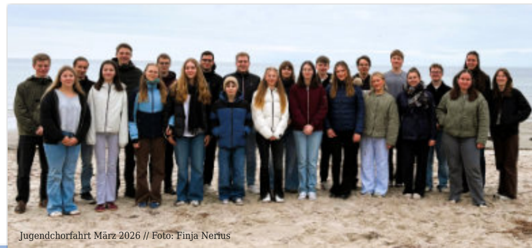
Jugendchorfahrt März 2026

dienstags, von 17:30 - 19:00 Uhr Gemeindehaus Ludwigslust mit Kantor Janes Wendt Tel.: 03874 21968 E-Mail: jannes.wendt@elkm.de