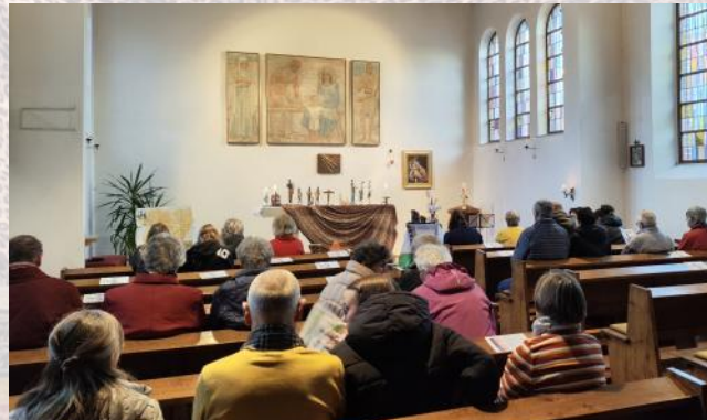
Nigeria – ein Land voller Facetten. Gemeinsam feierten wir Gottesdienst in der Katholischen Kirche Goldberg.

Ich danke allen Frauen, die beim Gottesdienst aktiv waren und auch allen fleißigen Helfern, die beim Auf- und Abbau und der Vorbereitung der Speisen geholfen haben – Ich freue mich schon auf die Reise im kommenden Jahr. [MS]