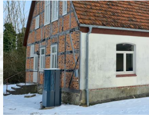
Seit Februar wird in Kuppentin klimafreundlich geheizt. [JB]

die Anlage sehr gut funktioniert und wir damit das Haus für die Zukunft gut ausgerüstet haben. [CB/JB]