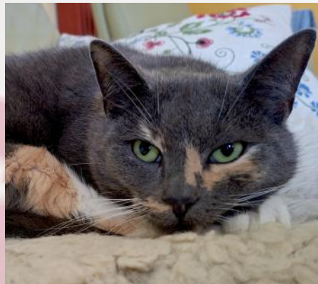
Cookie in ihrer Mittagsruhe [RF]

Junge aufziehen können und wir ihnen beim Fliegenlernen zusehen können. Ähnlich geht es dem Pastor mit seinen sieben Lämmern! Diese Kleinen halten ihn auf Trab. Eins kam mit der Hilfe