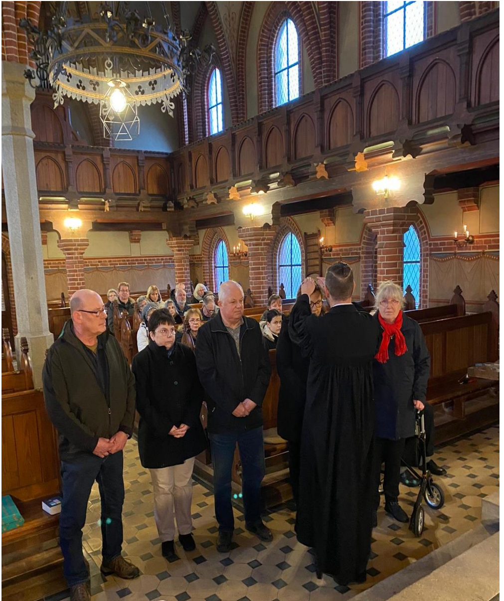
Einführung des Kirchengemeinderates