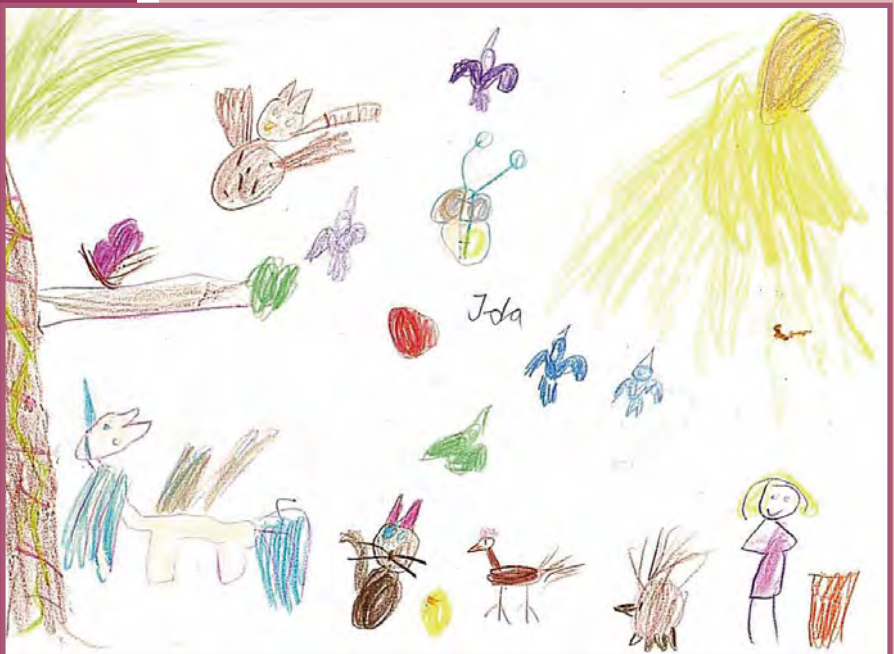
Ida Sündermann, 7 Jahre

Welcher große oder kleine Mensch gestaltet das nächste Titelbild für den Gemeindebrief?