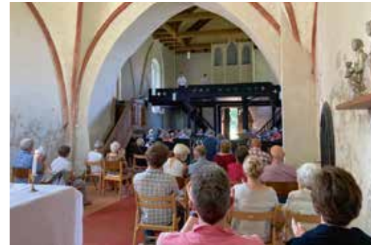
„Orgeltörn“ in Zettemin am 20.06.2021