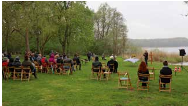
Himmelfahrt, Gottesdienst am Kleinen Varchentiner See am 13.05.2021