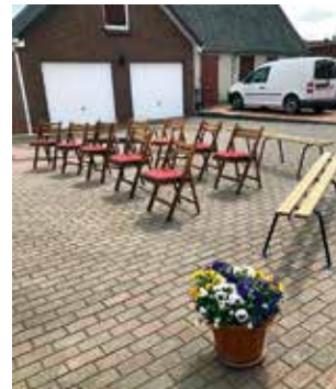
Hofgottesdienst am 13.06.2021 in Gielow