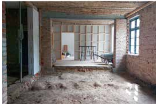
Umbau des Gemeinderaums im Pfarrhaus in Rittermannshagen seit April 2021