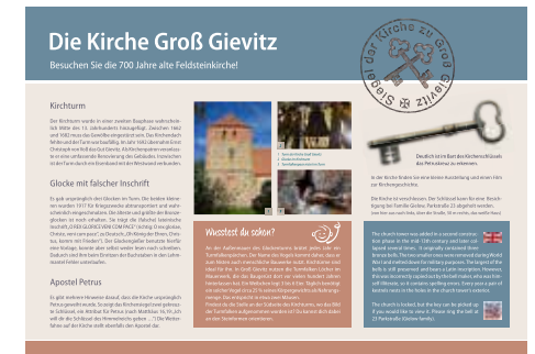
Tafeln zur Kirchengeschichte – geplant für den Kirchhof