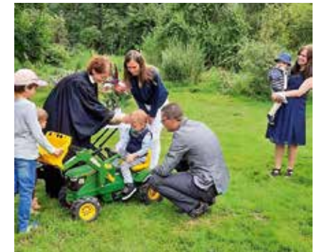
Gartengottesdienst in Rittermannshagen am 22.08.2021