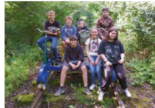
Konfis auf Fahrt, Draisinentour Waren – Schwinkendorf am 21.08.2021