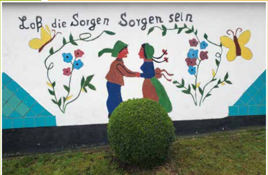
Stallgebäude der Familie Stefanski in Demzin

Welcher große oder kleine Mensch gestaltet das nächste Titelbild für den Gemeindebrief?