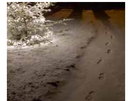
Weihnachten im Schnee