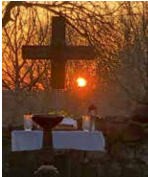
Ostern, Gottesdienst in der Wüsten Kirche Domherrenhagen