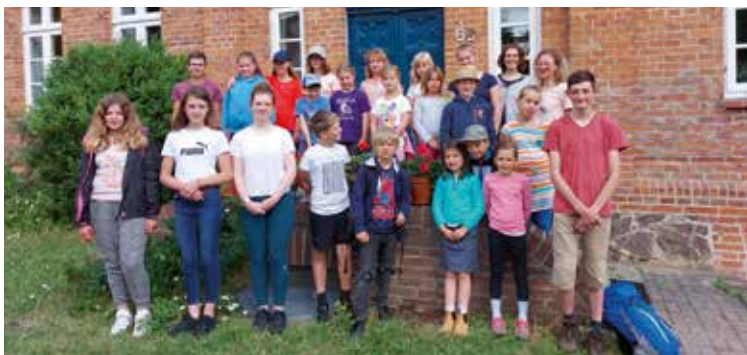
Pilgerfreizeit im Pfarrsprengel Gielow-Rittermannshagen vom 27.06. – 02.07.2021