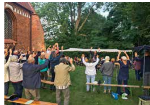
Posaunenfest in Rittermannshagen am 12.09.2021