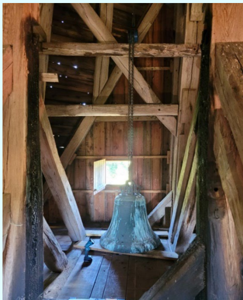
GLOCKE KIRCHE PARUM

Nach langem Warten und Spendensammeln konnten die Sanierungsmaßnahmen an der Glocke der Kirche Parum endlich beginnen. Nachdem sowohl die Glockenstube als auch der Kirchen-Dachboden von einer Fachfirma professionell gereinigt wurden, erneuerte die Tischlerei Kleine anschließend den Boden in der Glockenstube, so dass alle folgenden Arbeiten sicher ausgeführt werden können. Am 11. Juli 2022 war es dann endlich so weit, die Glocke wurde abgesenkt und in das größere Glockenfach umgestellt. Der Klöppel wurde entfernt und die Glocke wurde zur Anfertigung des neuen Klöppels aufwendig vermessen. Die Glocke wiegt 529 kg und wartet auf das stärkere Joch. Das alte Joch wurde entfernt. Und das Joch des großen Glockenfaches wird nun aufgearbeitet und ein neuer Klöppel gegossen.