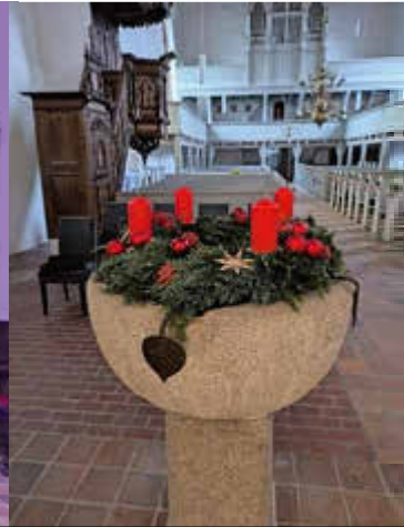
Krippenspiel - Adventlicher Taufstein – Weltgebetstag aus Nigeria – Pilgerweg am Sonntag Lätäre von Demern nach Carlow