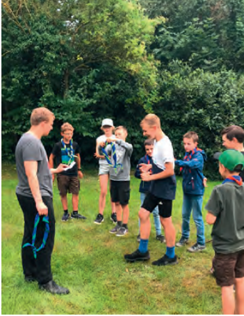
Unsere Pfadfinder im Sommer.