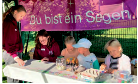
Familienfest zum Weltkindertag.

Am 24. September war Hohen Viecheln Gastgeber des anlässlich des Weltkindertages vom Kreisjugendring Nordwestmecklenburg ausgerichteten Familienfestes. Zahlreiche Vereine und Organisationen aus Hohen Viecheln und Umgebung haben mit verschiedensten Angeboten zu einem gelungenen Festtag an der Badestelle beigetragen. Auch wir