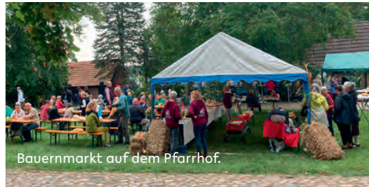
Bauernmarkt auf dem Pfarrhof.

Wir bedanken uns bei allen, die die Arbeit unserer Kirchengemeinde in diesem Jahr mitgestaltet und unterstützten! Danke für Ihre Mithilfe im Gartencafé und bei den Märkten, danke für das Gestalten besonderer Anlässe, danke für alle tatkräftige Hilfe, für alles Mitdenken. Und: Danke für Ihre Spenden, die das vielfältige Leben unserer Kirchengemeinde erst ermöglichen!