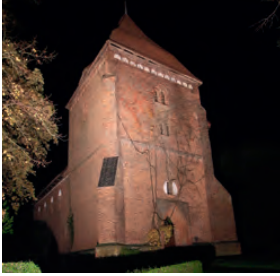
Lübower Kirche mit neuer Beleuchtung.