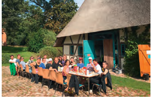
Das Fahrrad-Vokalensemble beim Frühstück.