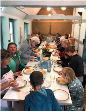
Nach dem Spaghetti-Gottesdienst.