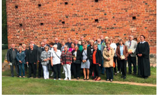
Jubelkonfirmation in Beidendorf.