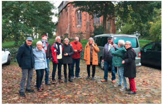
Überraschender Besuch von unserer holländischen Partnergemeinde aus Eibergen.