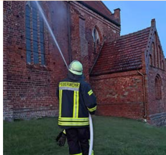
Feuerwehübung Dorflirche Tarnow