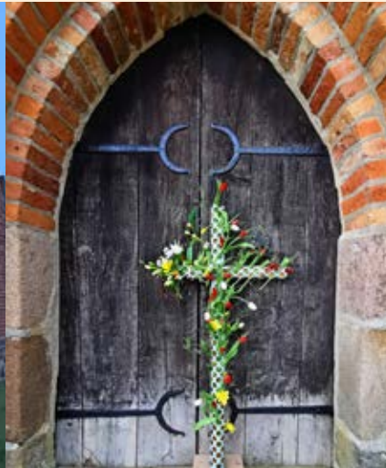
Ostersonntag in Zehna