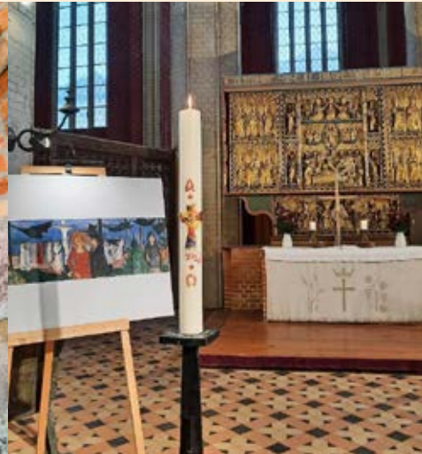
Osterkerze in der Stiftskirche