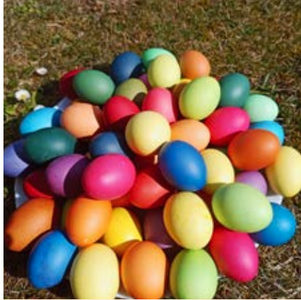
Ostereier für die Stiftskirche