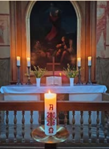
Ostermorgen in Boitin