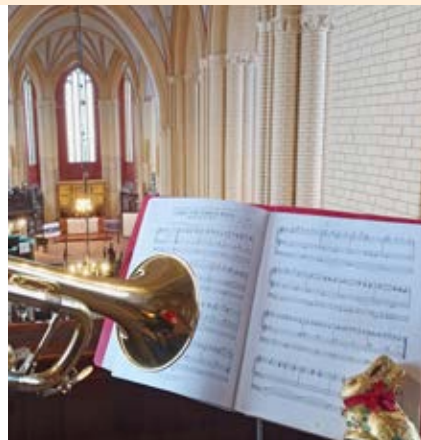
Ostergottesdienst Stiftskirche