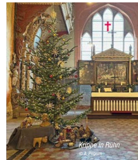
Krippe in Rühn