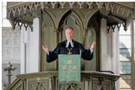
Bischof Jeremias lädt zum Festgottesdienst mit reichlich Segen

Am Sonntag, dem 1. März, wird der Bischof im Sprengel Mecklenburg und Pommern in der evangelischen Kirche