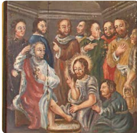
Fußwaschung, Szene vom mittelalterlichen Altarflügel in der Sakristei der Kirche zu Qualitz

In der Passionsandacht der Karwoche möchte ich mit Ihnen 19 Uhr in der Kir- che Zernin ein weiteres Zeichen entde-