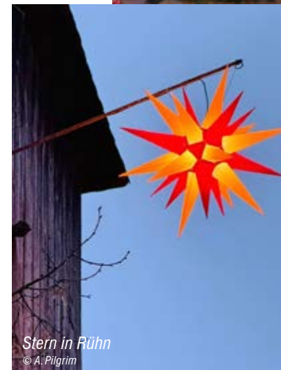
Stern in Rühn