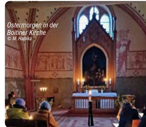
Ostermorgen in der Boitiner Kirche

Gemeinsam ziehen wir mit Kerzen in die unbeleuchtete Kirche und erleben die Wandlung vom Dunkel ins Licht.