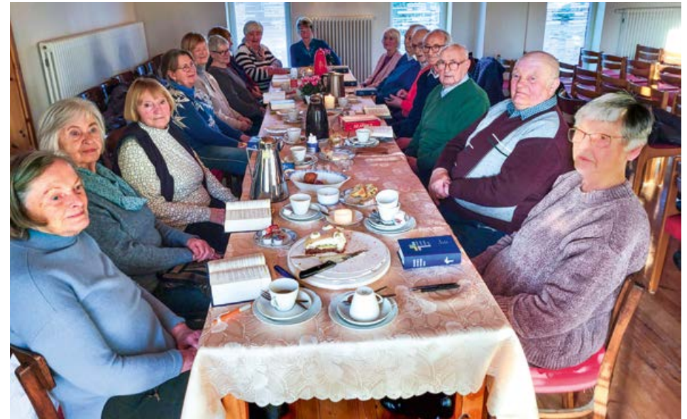
Der „OKÄ“ trifft sich jeden dritten Dienstag im Monat um 15.00 Uhr