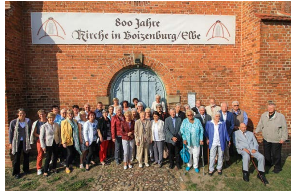
Jubelkonfirmation 2018 vor dem Südportal der Marienkirche

Wir freuen uns auf Sie! Und viele alte Bekannte auch!