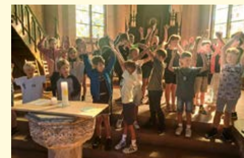
Die Abschlussfeier hat allen Beteiligten Spaß gemacht.

Ein großes Dankeschön an die ehrenamtlichen Begleiter und allen Helferinnen, die zum Erfolg des Sommerlagers 2024 beitragen haben. Diakonin Silke Jung