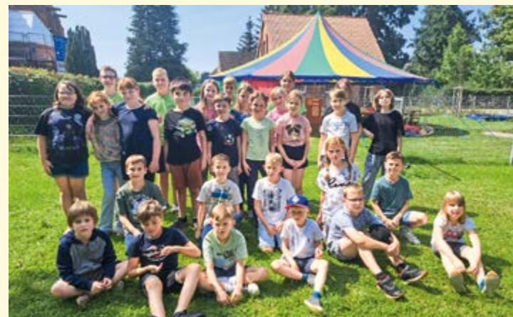
Die Kinder vom Sommerlager 2024