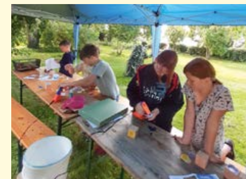
Tischgebete fanden auf einem Holzwürfel ihren Platz.