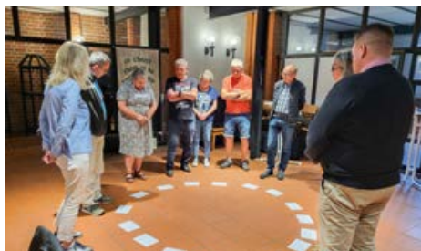
Erste gemeinsame Kirchengemeinderatssitzung im Juni 2025.

Die neuen Sprengel sind einerseits aus der Not heraus geboren: Aufgrund von Finanz- und Personalmangel gibt es im Bereich des Verbandes in Zukunft nur noch zwei Pfarrpersonen. Die Kirchengemeinderäte wollen diese neue Verbindung andererseits dafür nutzen, Synergien zu nutzen und gemeinsam Neues entstehen zu lassen. Dafür haben sie schon zweimal intensiv gemeinsam getagt: „Warum bin ich im Kirchengemeinderat? Was ist mein biblischer Leitsatz? Wo sehe ich Chancen und Gefahren der neuen Zusammenarbeit.“ Um diese grundsätzlichen Themen ging es ebenso wie um die ganz praktischen Fragen.