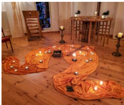
Regionale Taizé-Andacht in Zweedorf im März 2025