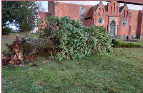
Der Februarsturm richtete erhebliche Schäden an, so wie hier auf dem Friedhof in Walkendorf.