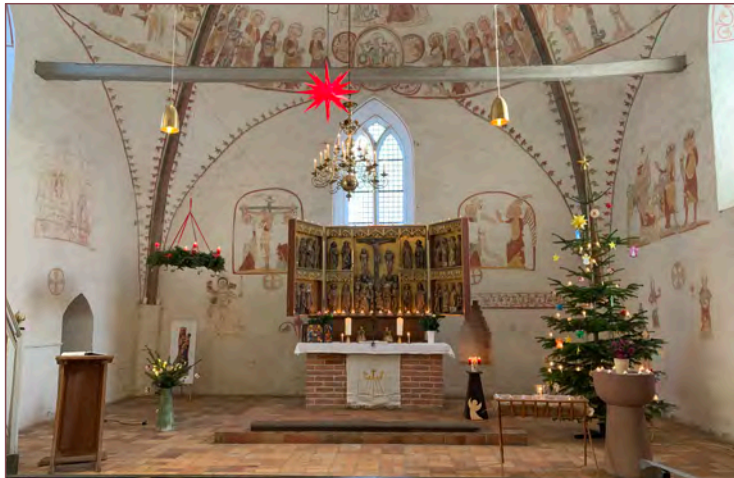
Zweiter Weihnachtstag in der Kirche Walkendorf.