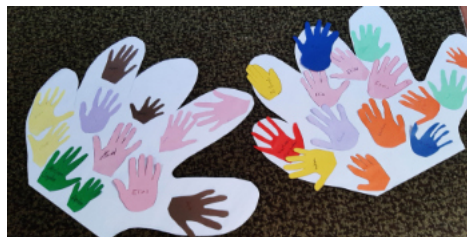
Tauferinnerung in Basse

Am Sonntag, 28.01.2024 um 14:00 Uhr. Wir feiern mit einem festlichen Gottesdienst den Abschluss der Arbeiten und laden anschließend zum Kaffeetrinken und Beisammensein ein.