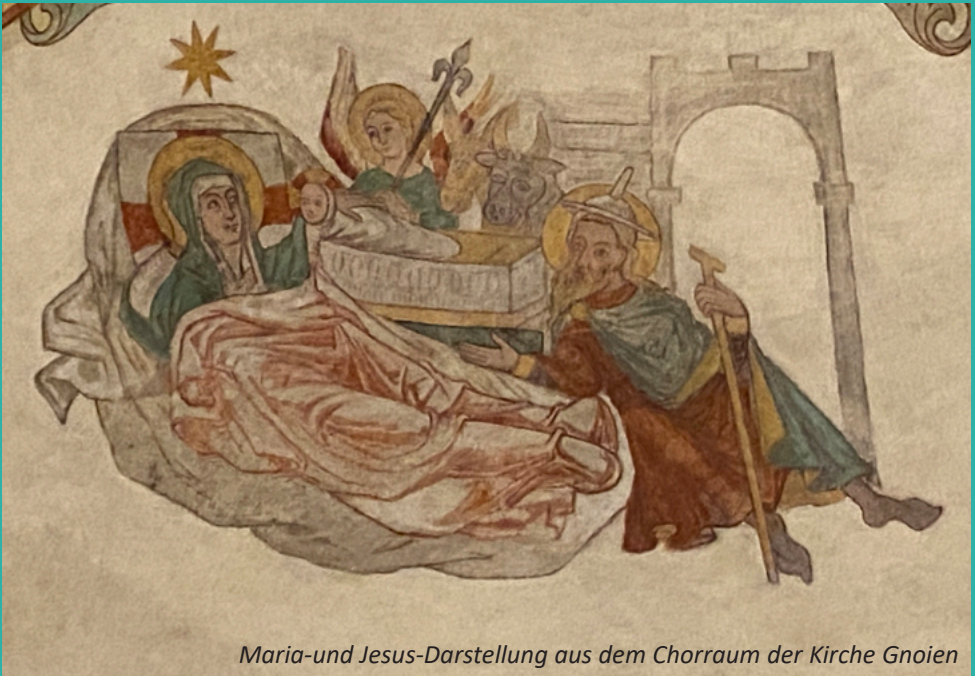
Maria-und Jesus-Darstellung aus dem Chorraum der Kirche Gnoien