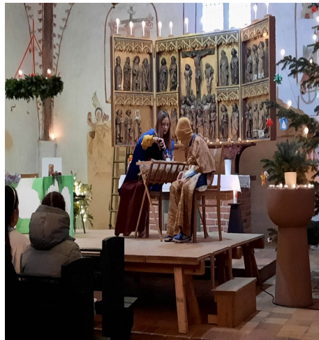
Rückblick: Christvesper Walkendorf