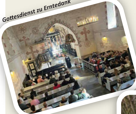
Gottesdienst zu Erntedank