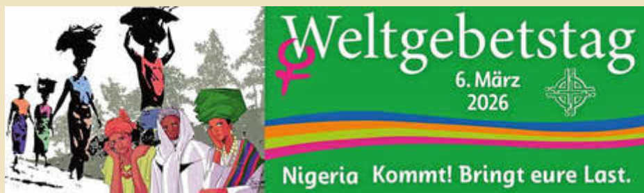
Titelbild 2026 Nigeria © WDPIC, von Gift Amarachi Ottah

Lasten solidarisch tragen - aber auch Lust, Kreativität und Freude miteinander teilen, dazu laden uns die Frauen in der Gottesdienstordnung ein.