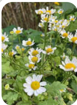
Blüten im Pfarrgarten