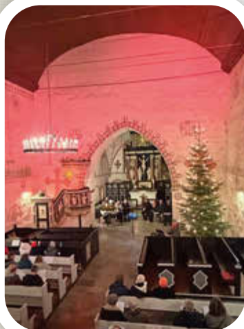
Willkommen im Advent