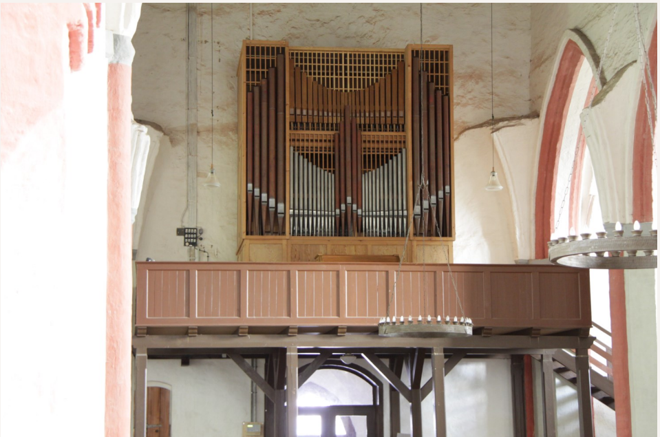
Text: Friedrich Drese

Am Sonntag, 26. Mai um 14.30 Uhr spielt Enno Gröhn aus Herford in Woldegk ein Improvisationskonzert. Die Konzerte in Golm und Woldegk sind mit Eintrittskarten zu 8 und 15 Euro zu besuchen.