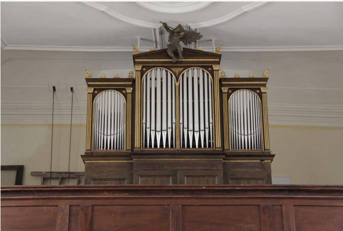
Orgel Kirche zu Göhren

Am Sonntag, 26. Mai um 14.30 Uhr spielt Enno Gröhn aus Herford in Woldegk ein Improvisationskonzert. Die Konzerte in Golm und Woldegk sind mit Eintrittskarten zu 8 und 15 Euro zu besuchen.