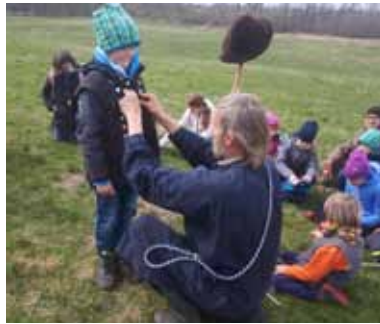
Zum Hütegehilfen umgezogen werden

Gut behütet bei Wind und Wetter mit einem gefilzten Schäferhut, der auch als Rufverstärker funktioniert, damit alle Schafe die Rufe des Schäfers gut hören