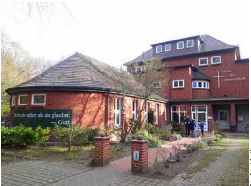
Haus der Landeskirchlichen Gemeinschaft in der Hundertmännerstraße