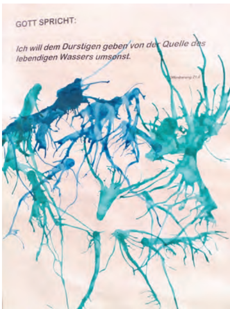
Eines der vielen Ergebnisse