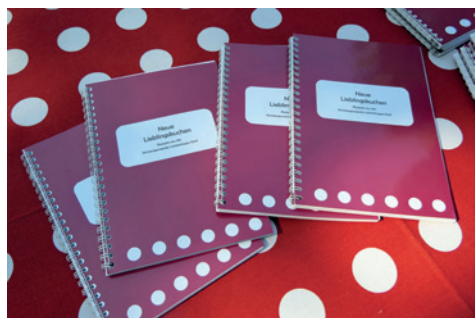
Backbuch mit leckeren neuen Rezepten

unsere Gäste sehr. Unsere ehrenamtliche Arbeit in der Vorbereitung, Durchführung und Nachbereitung des SommerCafés gelingt durch die jahrelang erprobte und immer wieder verbesserte Struktur. Dies zeigt sich in konstruktiven Absprachen und dem wertschätzenden Miteinander. Uns liegt es am Herzen, eine Kultur der Einladung, der Gastfreundschaft und der Freundlichkeit zu leben. Mit einem überwältigenden Erlös von 13.472 € möchten wir der Kirchengemeinde einen Teilbeitrag für künftige Bautätigkeiten am Pfarrhaus übergeben sowie Anschaffungen für unser SommerCafé 2024 planen. Bei unserem Dankeschön-Kaffee am 7. September bedankten wir uns bei all den ehrenamtlichen Frauen und Männern mit einer besonderen SommerCafé-Motiv-Tasse. Wir freuen uns auf die nächste Saison, dann können wir unser 10-jähriges Jubiläum feiern. Bis dahin bleiben sie gesund und wohl behütet. • Herzliche Grüße Ihr SommerCafé-Team