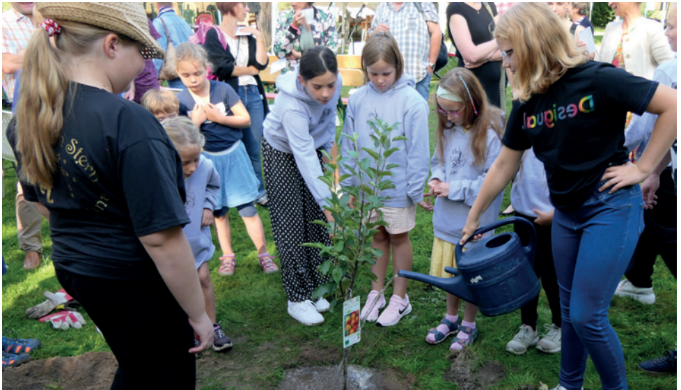
Familiengottesdienst „Der ist wie ein Baum“ zum Schulbeginn mit Baumpflanzaktion