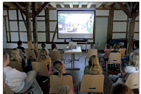
Neue Stühle, Leinwand und Beamer im Saal der Scheune