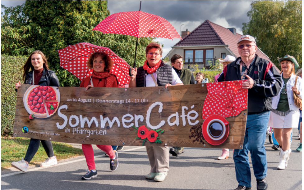
Beim Festumzug zum Erntedankfest ist unser SommerCafé dabei