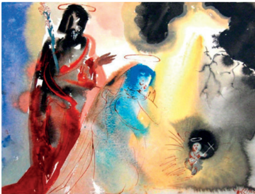
Salvador Dalí, Die Geburt Jesu