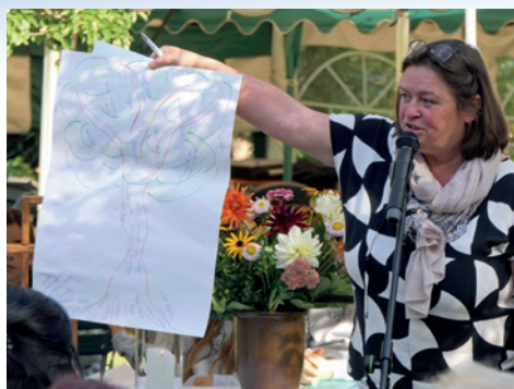
Gottesdienst zum Schulbeginn im Pfarrgarten am 17. September

Kleinere Kinder (0 - 5 Jahre) und deren Eltern erwartet ein fröhlicher Vormittag mit Singen, Spielen, Basteln und kleinem Frühstück. Wir treffen uns am 06.12.2023, 31.01. und 21.02.2024 von 9:30 - 11 Uhr in der Pfarrscheune in Lichtenhagen. Am 31.01.2024 feiern wir Fasching - bitte ein Kostüm mitbringen.