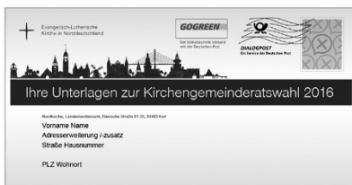
Der Brief zur Kirchenwahl

Anfang Oktober bekommen Sie Post von der Nordkirche. Die fast zwei Millionen wahlberechtigten Kirchenmitglieder, die spätestens am 13. November mindestens 14 Jahre alt sind, bekommen ihre Benachrichtigung für die Kirchenwahl. Die Wahl findet in der Zeit vom 13. bis zum 27. November 2016 statt.