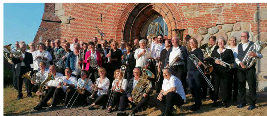
Bläser vor der Kirche Selent 2023