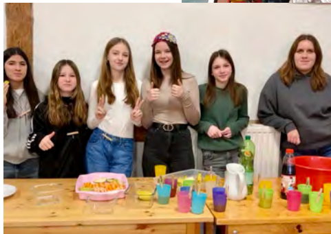
Text und Photos K.Manthey, G.Jansen