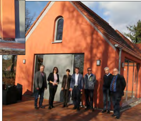
Ev. Gemeindehaus Groß Trebbow