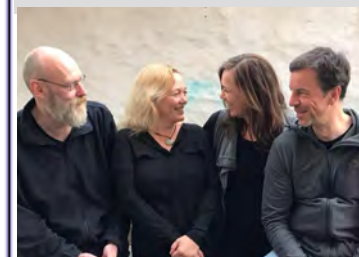
Mustard & Milk

Freitag, 7. Juli 2023 19:30 Uhr Kirche Kirch Stück Picknick-Konzert