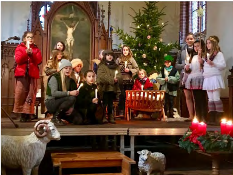
Die KrippenspielerInnen am Heiligen Abend in Alt Meteln