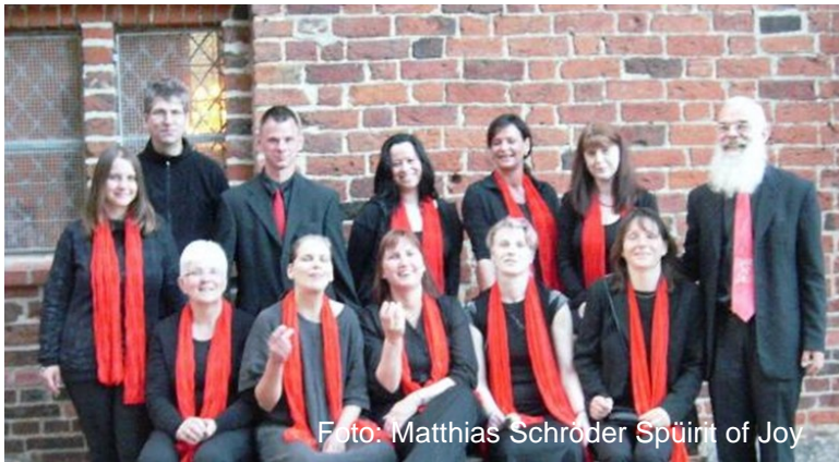
Spirit of Joy