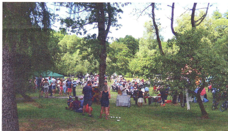
Blick in den Pfarrgarten beim Johannistfest

Wann: Sonnabend, den 17. November 2018 14 Uhr, Eintritt: 5 Euro