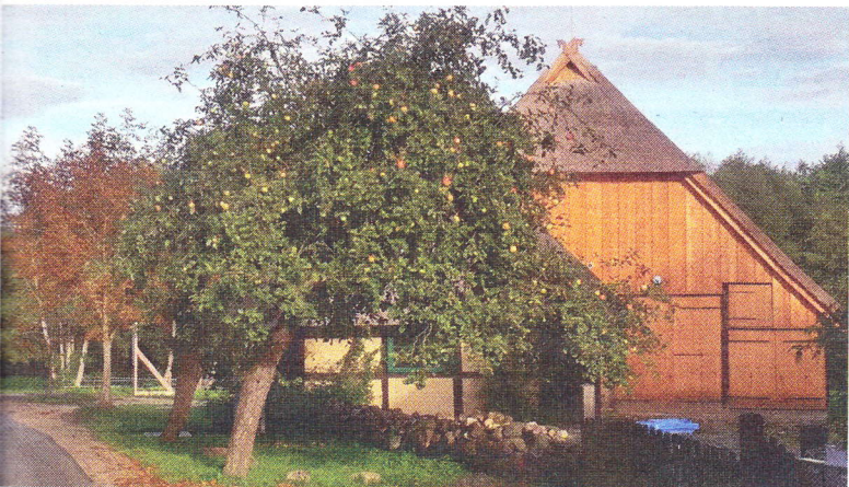
Pfarrscheune aus Richtung Kirche

Der Ortsteil der Gemeinde Cramonshagen liegt idyllisch am Nordufer des Cramoner Sees, nur ein paar Kilometer nordwestlich von Schwerin. Weithin sichtbar weist die alte Johanniter-Kirche mit ihrem goldenen Wetterhahn auf dem Glockenturm den Weg zum Pfarrhof und damit zur Scheune. Nur ein Katzensprung weg von Scheune, Kirche und Pfarrhaus: der Cramoner See. Das Kleinod der Dörfer ringum, mit seinem klaren, sauberen Wasser ist ein Dorado für Angler, Schwimmer oder Spaziergänger. Und genau hinter der alten Scheune nimmt die Stepenitz wieder ihren Lauf auf, jetzt durch das nach ihr benannte Tal in Richtung Träve. Ein Stück intakte Natur, einmal mehr, weil seit diesem Sommer die Fischtreppe dafür sorgt, dass Aal oder Barsch wieder den Weg ihrer Urahnen folgen können, ohne störende Wehre. So intakt, dass selbst der seltene Eisvogel an den Ufern gut Bruthöhlen findet, aber auch Graureiher und Fasan, Wildschwein und Reh, Fuchs und Dachs fühlen sich wohl.