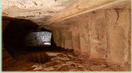
Treppe abwärts von der Orgelempore in der Kirche Hohen Luckow