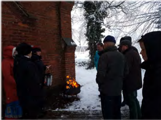
Osternmorgen 2018 an der Kapelle Jürgenshagen

Am Ostersonntagmorgen, 4. April treffen wir uns um 7 Uhr in der Kapelle Jürgenshagen zur Morgenfeier und anschließend gibt es die traditionelle Osterkerzen-Prozession von Jürgenshagen nach Neukirchen .