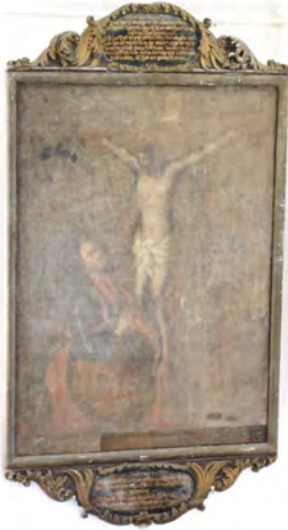
Das Gemälde vor der Restauration

Hohen Luckow hängenden, riesigen Ölgemälde schenkte kaum ein Kirchenbesucher gebührende Beachtung, musste der Betrachter doch schon fast über hellseherische Fähigkeiten verfügen, wollte er das Dargestellte erkennen und verstehen.