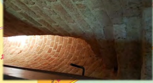
Treppe zum Gewölbe in der Kirche Bernitt