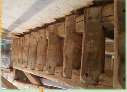
Treppe im Turm der Kirche Moissall