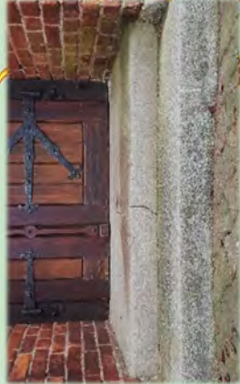
Treppe vor der Kapelle Jürgenshagen

An diesem Platz unseres Gemeindebriefes werden Details der Kirchen in unserem Pfarrsprengel vorgestellt. In dieser Ausgabe: Treppen