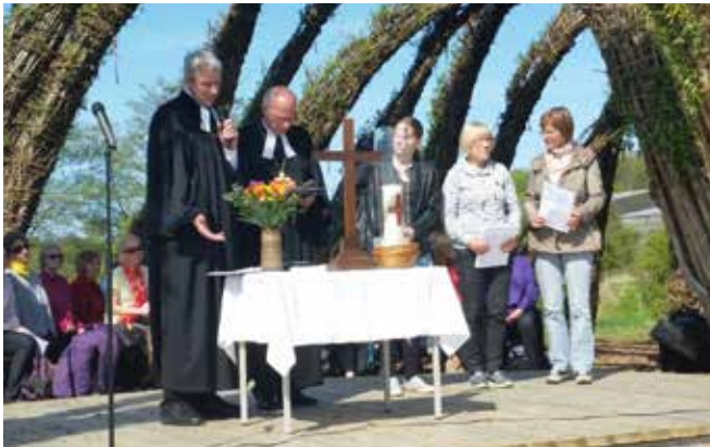
Himmelfahrtsgottesdienst am Weidenschneck mit Landesbischof Ulrich