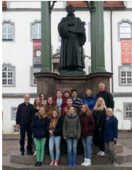
Konfirmandengruppe in Wittenberg