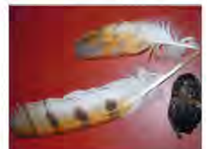
Bild 1 Schleiereule