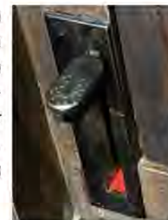
Das Bild zeigt den Schwelltritt der Orgel in Boizenburg. Sie ist übrigens die einzige Orgel in unserem Kirchengemeindeverband, die einen Schwelltritt hat.

2.) Den Schwelltritt wenden Organistinnen und Organisten an. Es handelt sich um eine Vorrichtung, die mit den Füßen bedient wird – also um einen Tritt. Innerhalb mancher Orgeln befindet sich ein Teil der Pfeifen in einem Gehäuse. An diesem Gehäuse wiederum sind Klappen angebracht, die über diesen Tritt geöffnet und geschlossen werden können. Dadurch lässt sich die Lautstärke beeinflussen – der Klang lässt sich sozusagen an- und abschwellen.