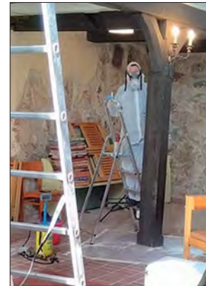
Kein Corona, nur Holzwürmer

Das ist eine wichtige Voraussetzung für die Restaurierung und den Wiedereinbau der Orgel noch in diesem Jahr.