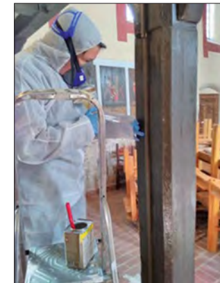
Im Vollschutz wird jedes Wurmloch behandelt