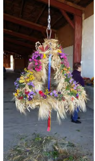
Erntedank in Döbbersen und Neuenkirchen