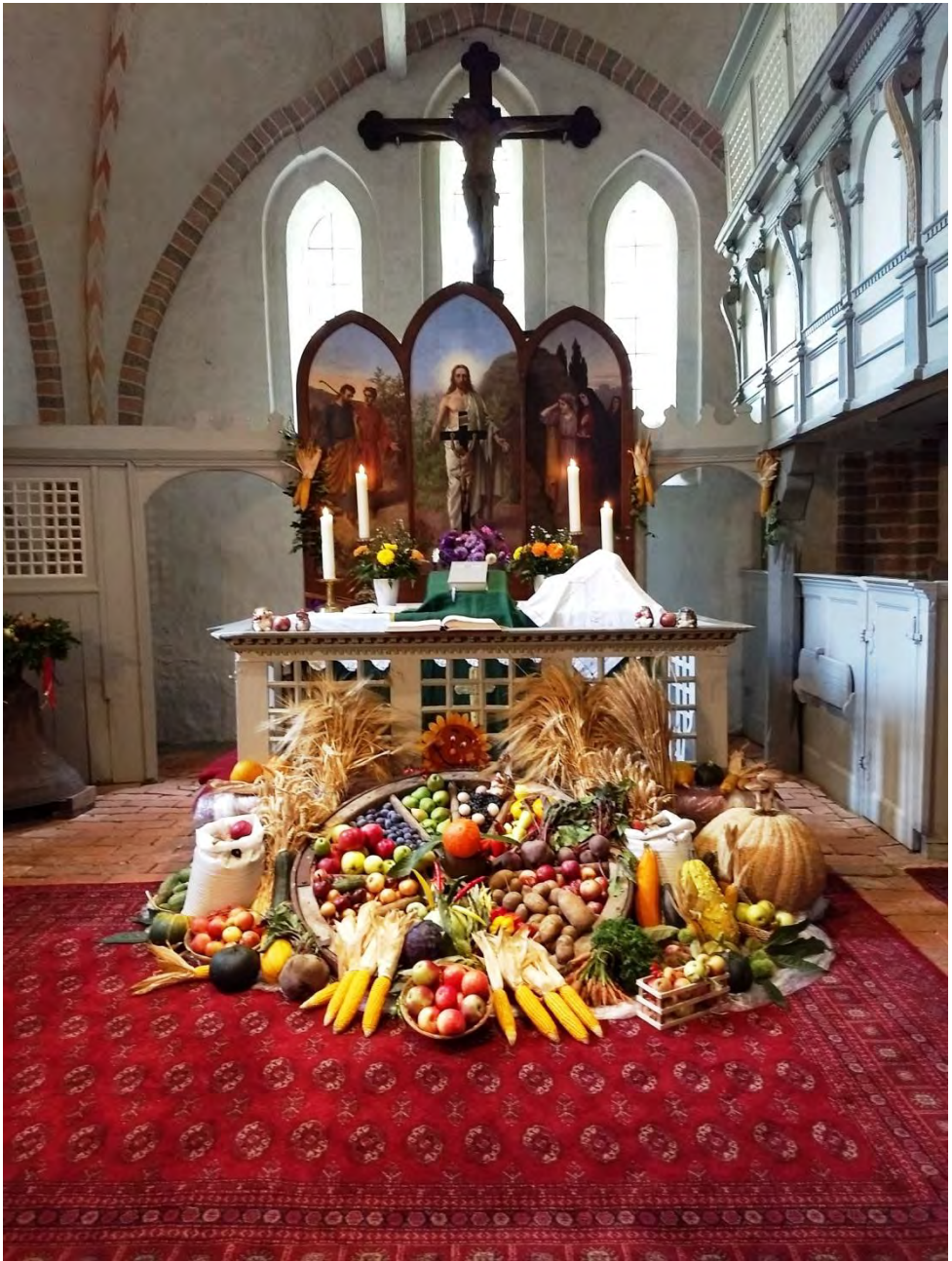
Erntedank in St. Abundus, Lassahn