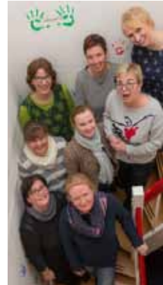
„Wir freuen uns auf euch!“