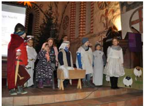
Mini-Krippenspiel des Kirchenmauskreises der KiTa Broderstorf