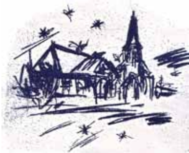
Grafik: Mirko Grunewald

11 Uhr Gottesdienst zum Advent 12 Uhr Markteröffnung mit adventlicher Bläsermusik