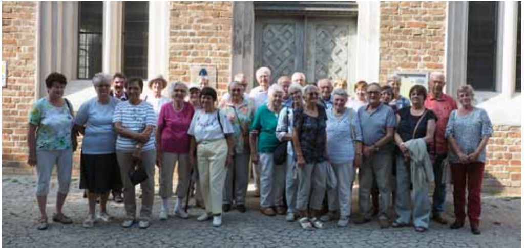
Ausflug ins Salzmuseum nach Schwaan im September 2018