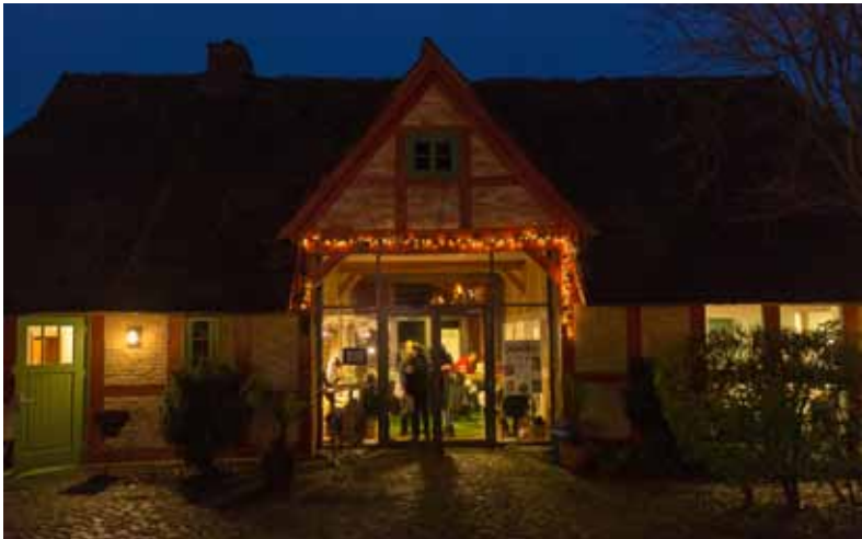
Kessiner Adventsmarkt 2017

Adventsmarkt 2. Dezember 12.00 Uhr bis 17.00 Uhr Pfarrhof Kessin