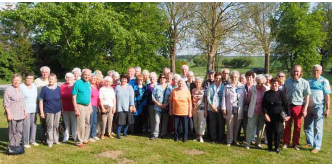
Seniorenausflug im Mai 2016 nach Dorf Mecklenburg

Die Kosten pro Person für Busfahrt und Kaffeetrinken betragen 20,-€. Wer über den Seniorenkreis hinaus mitkommen möchte, ist ebenso eingeladen.