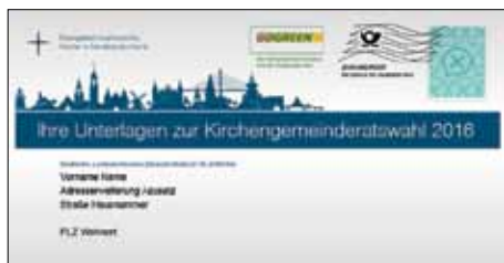
Der Brief zur Kirchenwahl

Anfang Oktober bekommen Sie Post von der Nordkirche. Die fast zwei Millionen wahlberechtigten Kirchenmitglieder, die spätestens am 13. November mindestens 14 Jahre alt sind, bekommen ihre Benachrichtigung für die Kirchenwahl. Die Wahl findet in der Zeit vom 13. bis zum 27. November 2016 statt.