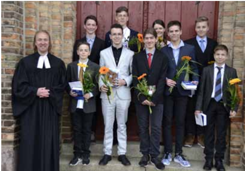
Konfirmation zu Pfingsten 2016 in Kessin