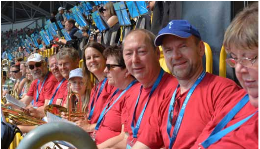
Kessiner Bläser auf dem Landesposaunentag in Dresden

Probezeit mittwochs 19.30 - 21.00 Uhr Torkaten Kessin