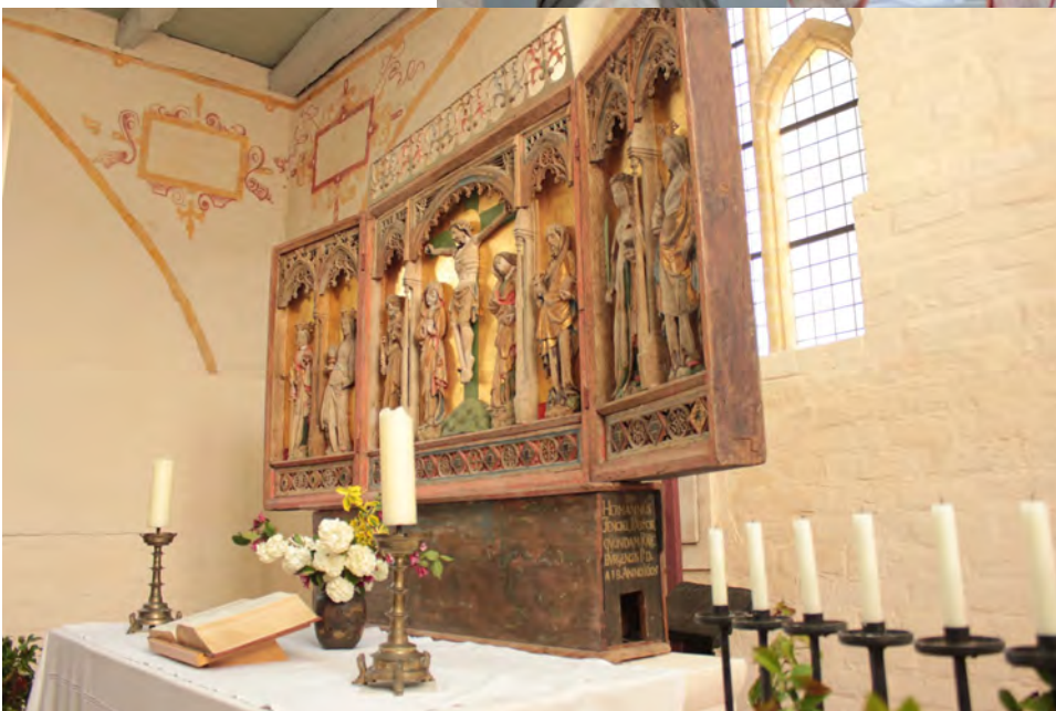
Der Altar in der Dorfkirche Demern