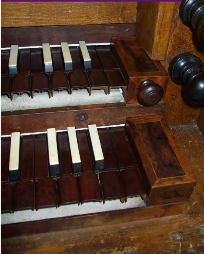
Detail der Schönberger Orgel

Das war ein Akt, der Folgen hatte. Denn im folgenden Jahrhundert breitete sich die Orgel in mehreren christlichen Kirchen aus, bald sogar im eben erst christianisierten England. Aus dem weltlichen Instrument wurde ein Kultinstru-