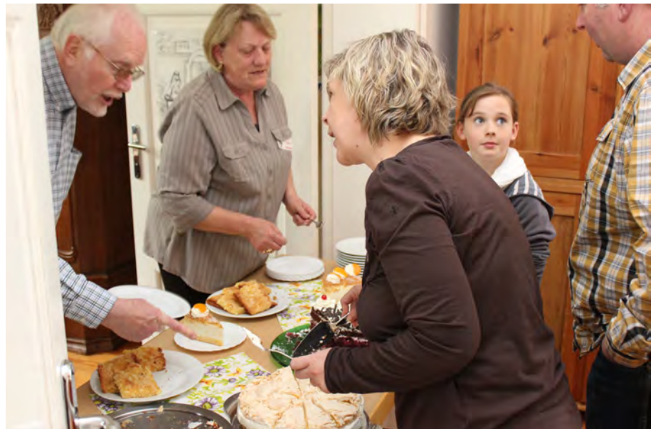
Auf dem Pfarrhof gab es ein Kaffeetrinken mit großer Kuchenauswahl