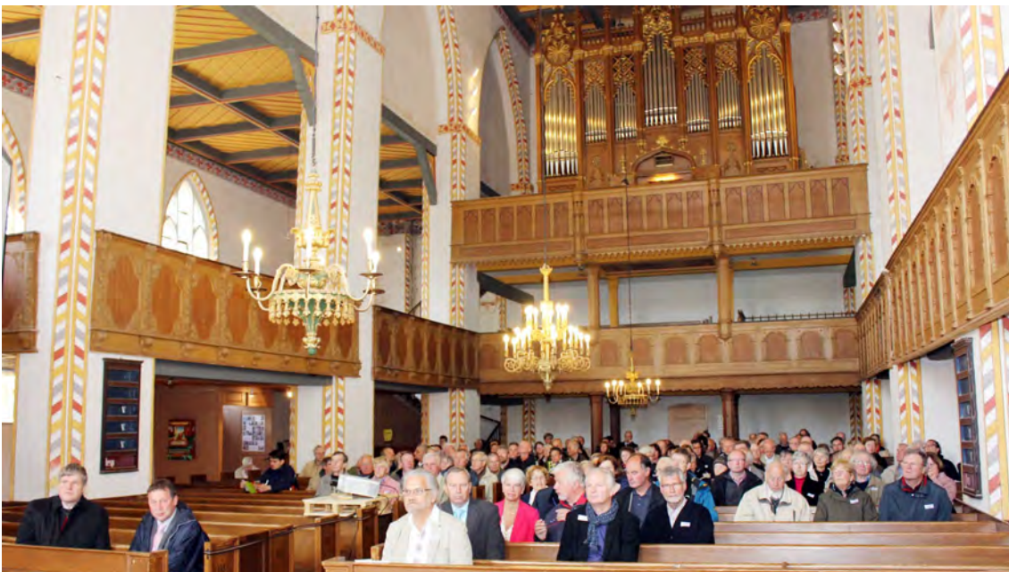
Blick auf die Orgelempore in der Schönberger Kirche