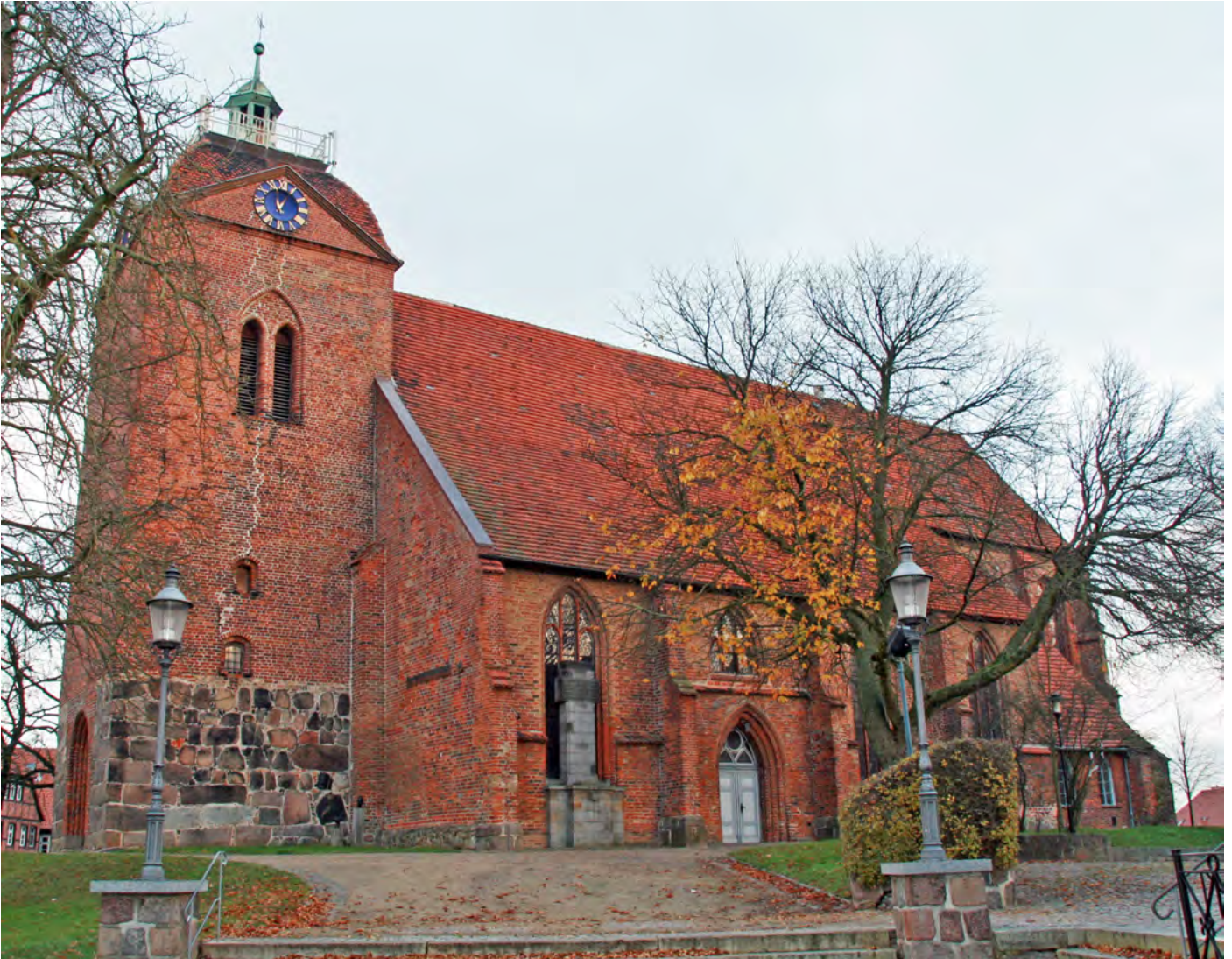
Die Sankt Laurentius Kirche zu Schönberg