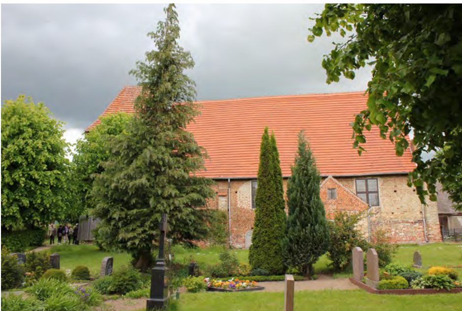
Die Dorfkirche Demern