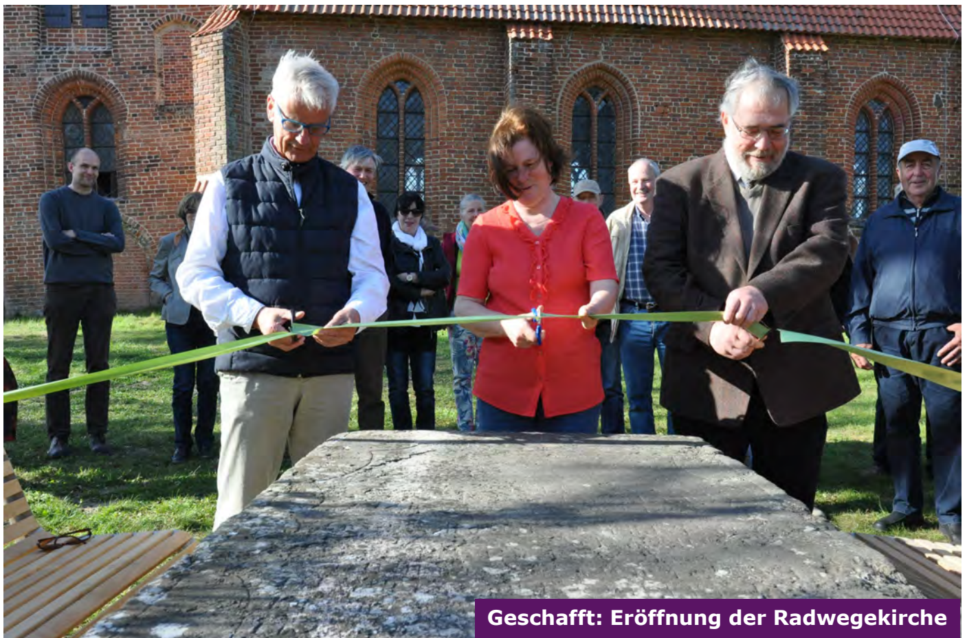
Geschafft: Eröffnung der Radwegekirche

kirche, als Übernachtungsstätte für Radwanderer genutzt werden.