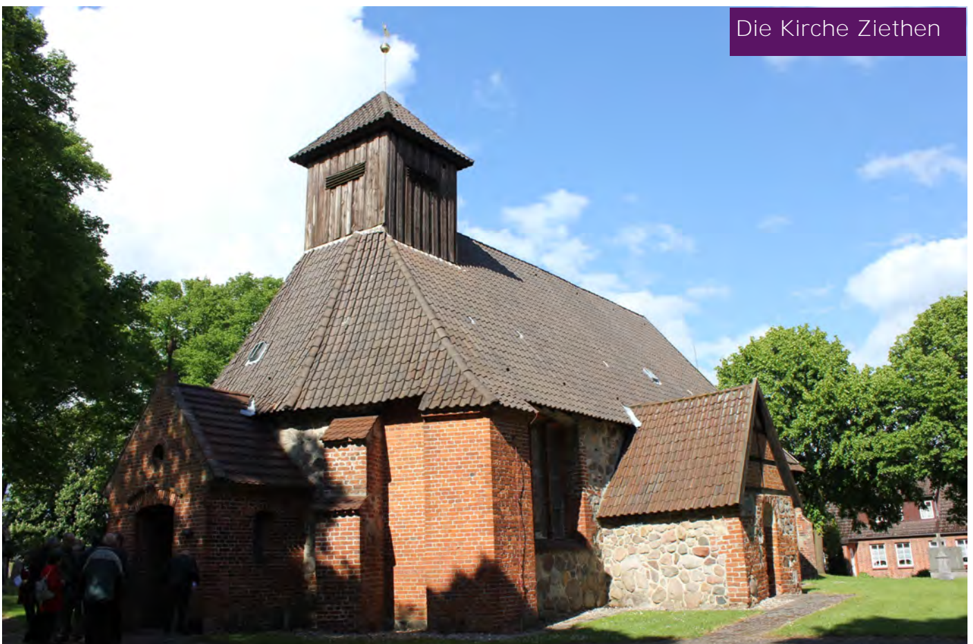
Die Kirche Ziethen

Das Objekt unserer Stiftung sollte uns Freude machen, nicht nur unsere Mittel verspeisen, sondern unsere Gedanken mit Lust erfüllen. Auf unseren vielen beruflichen Reisen ist uns Kirchenkunst immer wichtig, und freie Stunden verbringen wir gern in den Kirchen des In- und Auslandes. Der Schritt zur Deutschen Stiftung Denkmalschutz war schnell getan. Nun ging es um die Objektfindung. Uns war klar, mit unserer kleinen Stiftung (100 TDM) können wir keine Dome retten. Aus beruflichen Gründen lernten wir nach der Wende Mecklenburg-Vorpommern näher kennen, seine liebenswerten Menschen und die vielen wunderschönen, dem Verfall preisgegebenen Baudenkmäler. So näherten wir uns dem Gedanken an eine