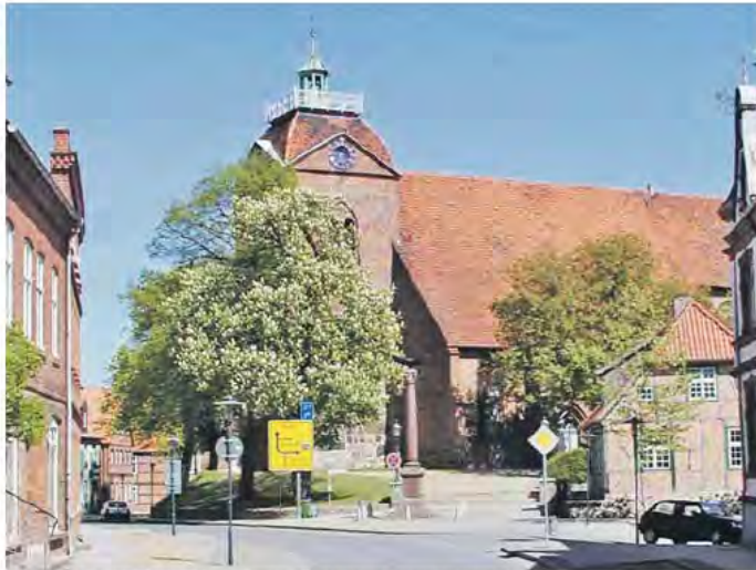
Die Kirche in Schönberg sollte ursprünglich noch größer gebaut werden.

Die Laurentiuskirche wirkt reichlich überdimensioniert für eine so kleine Stadt mit rund 4300 Einwohnern. Der Kirchbau thront