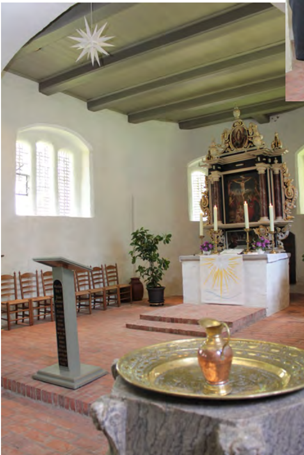
Der Altarraum in Ziethen