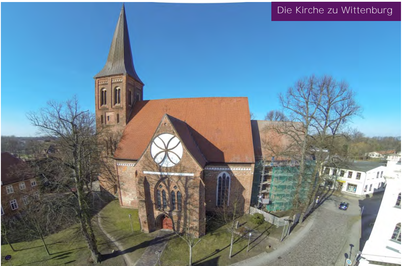
Die Kirche zu Wittenburg

In unserem Kirchengemeinderat gibt es einen Bauausschuss. Lange Zeit dachte man, das reicht, um die Renovierungsarbeiten irgendwie beginnen zu können. Als dann die vorläufige Schätzung der Kosten allein nur der Renovierung der