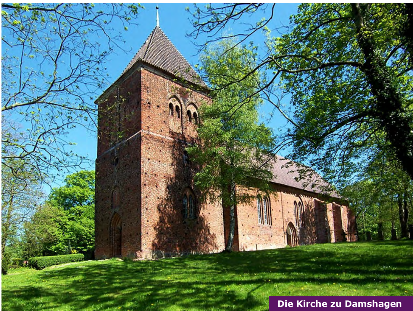
Die Kirche zu Damshagen

Bis Mitte der 1520er-Jahre hatte der Bischof zu Schönenberge, wie die Quellen den Ratzeburger Bischof nennen, das Recht, die Pfarren im Klützer Winkel zu besetzen. Doch gegen die Herrschaftsansprüche der lokalen Adelsfamilien wie der Plessen kam er immer weniger an. 7 Die Kirchlehnrechte der Bischöfe wurden spätestens nach der obrigkeitlichen Einführung der Reformation 1549 durch eine noch unübersichtliche Gemengelage von Adels- und Herzogspatronaten