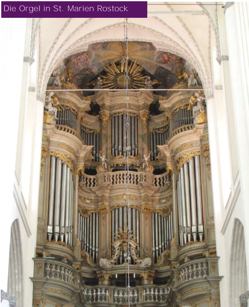
Die Orgel in St. Marien Rostock

Ich vermute, viele unter uns werden es bestätigen: eine intakte historische Orgel zu hören, ist ein Erlebnis. Die Restaurierung einer historischen Orgel wird