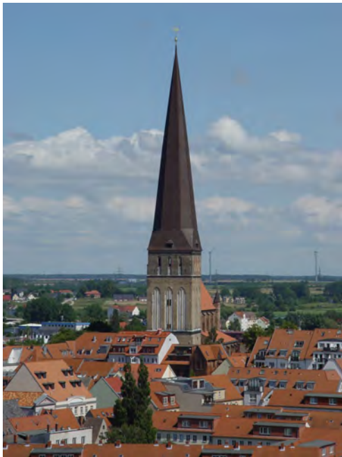
Die Petrikerkirche

Eröffnet wird die Ausstellung am 8. April im Anschluss an den Gottesdienst. Die Exponate dokumentieren das Leben der Frauen in ihrer Heimat, auf der Flucht und im Asyl. Sie erzählen vom Alltag in den Flüchtlingslagern und von der schwierigen Suche nach einer neuen Heimat. Eine Fotoreportage von