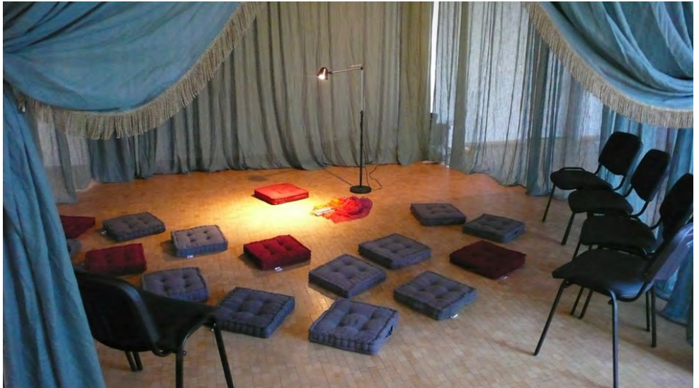
Alles bereit: Die GeschichtenWerkstatt lädt in ihr Zelt ein