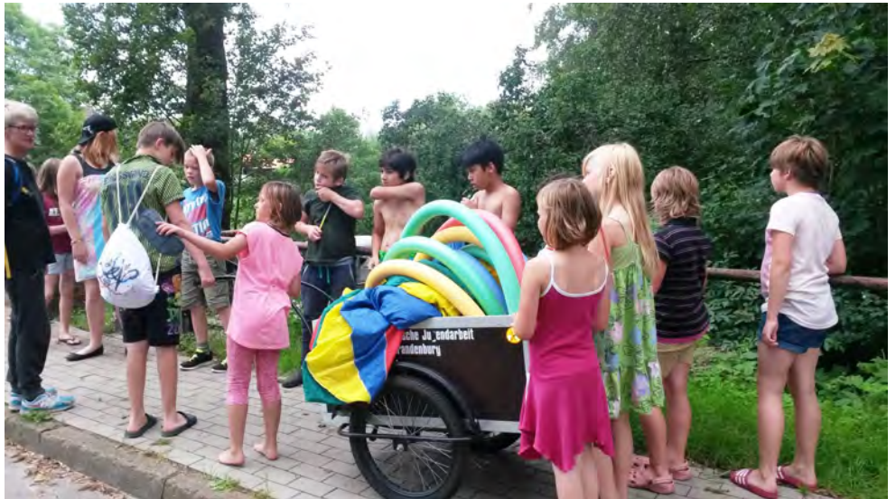
Die Fotos zeigen einige Eindrücke von geförderten Projekten

Kirchengemeinden wenden sich bitte mit ihren Fragen zur Projektentwicklung und zur Antragsstellung an Frau Gundert-Hock im Zentrum Kirchlicher Dienste Mecklenburg in