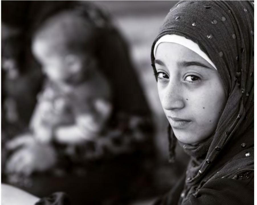
Ein Exponat aus der Ausstellung