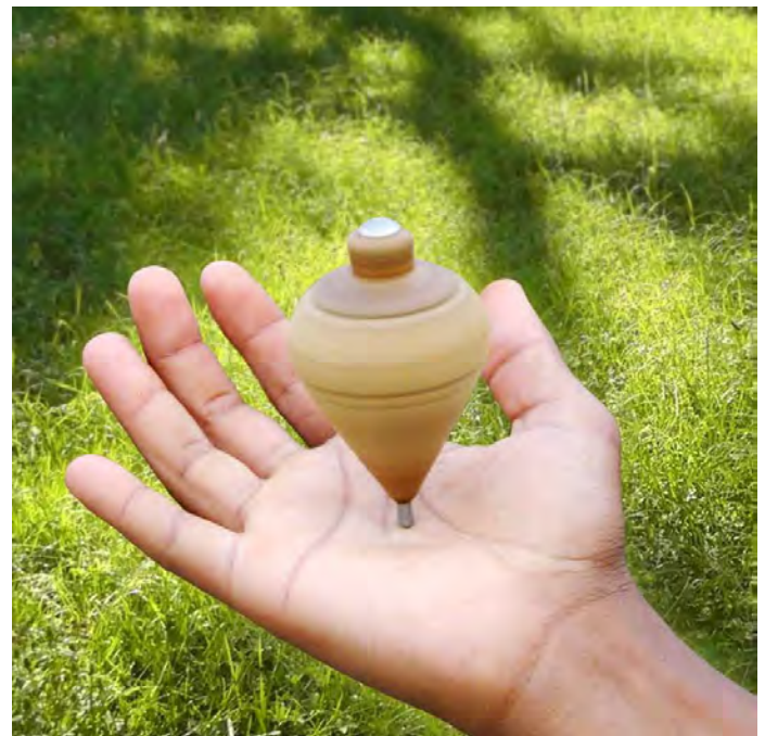
Titelseite der Broschüre

gustin: „Miteinander reden und lachen, sich gegenseitig Gefäl-