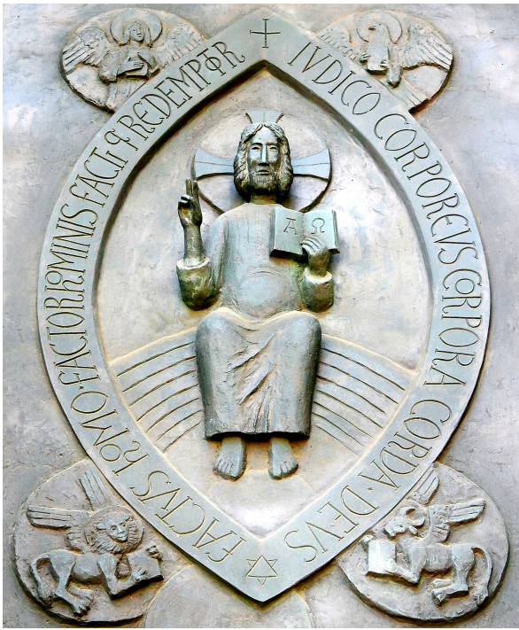
Bild: Friedbert Simon (Fotografie) / Willi Dirx (Künstler) In: pfarrbriefservice.de

Auch Jesus ist ein unschuldig Leidender, - Verrat, falsche Zeugen, schwache Menschen - , bringen ihn ans Kreuz. Alles wendet sich gegen ihn, auch Gott. „Da ist kein Helfer!“ - „Mein Gott, mein Gott, warum hast Du mich verlassen!“ (Psalm 22)