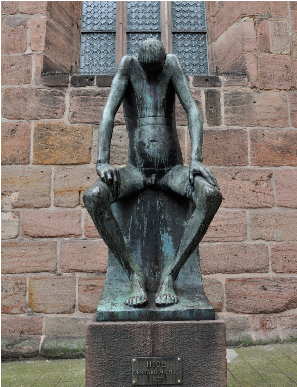
Bild: Christine Limmer (Foto) | Gerhard Marcks (Skulptur) In: pfarrbriefservice.de

Ich lese gerade im Buch Hiob. Es bewegt mich sehr, denn was zur Zeit bei uns geschieht, isoliert Menschen wie damals Aussätzige isoliert waren, abgeschottet, ausgeschlossen von der Gesellschaft.