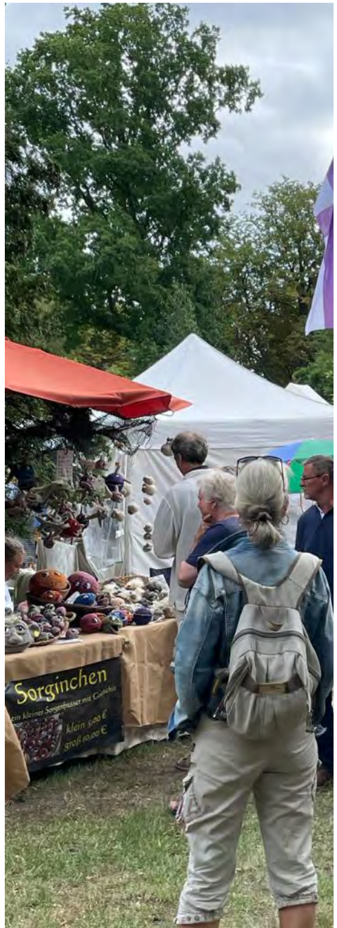
Seemannskirchenfest Prerow