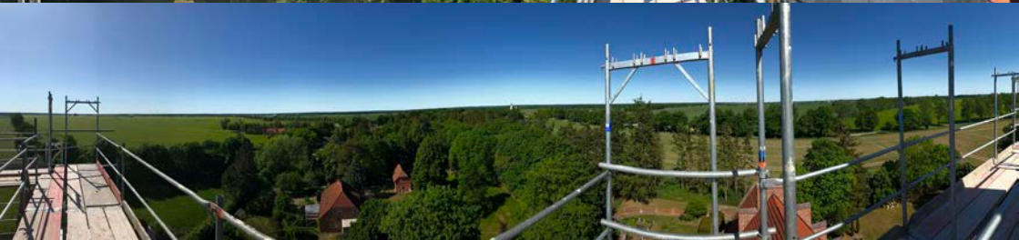
Panorama vom Kartlower Kirchturm